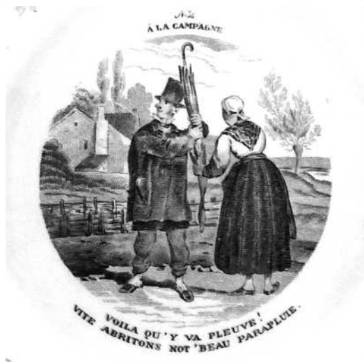
- 2 -