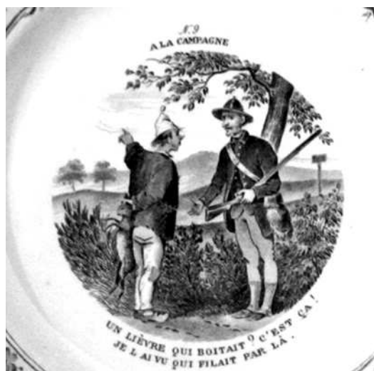
- 9 -