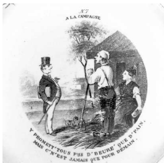
- 7 -