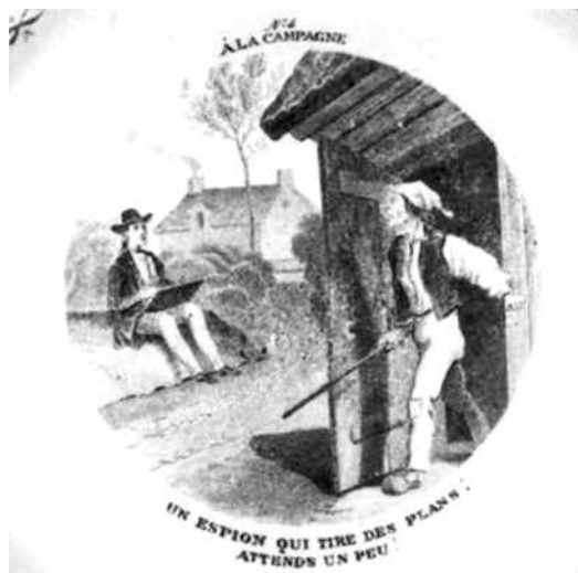
- 4 -