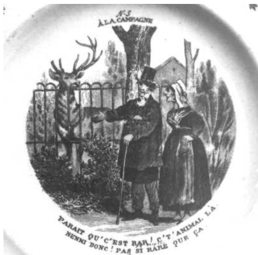
- 5 -