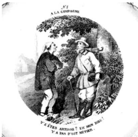
- 1 -