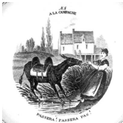
- 8 -