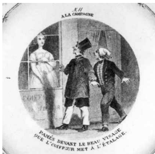
- 11 -