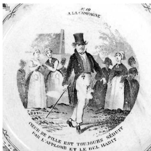
- 10 -