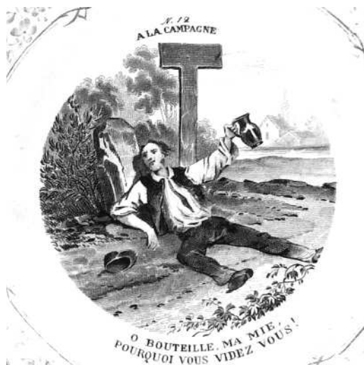
- 12 -