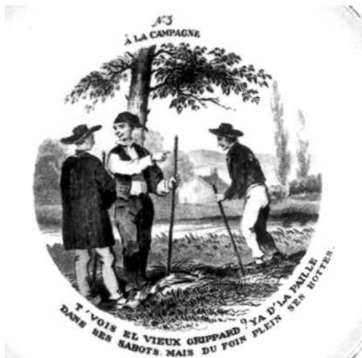
- 3 -