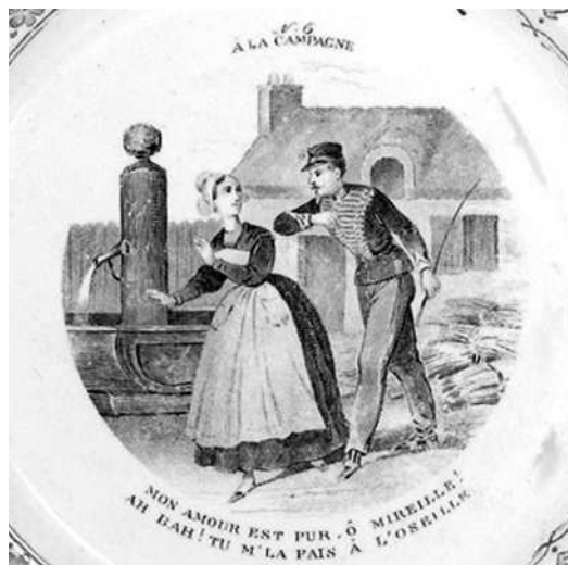
- 6 -