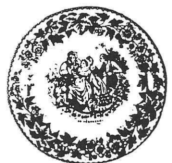
CREIL et MONTEREAU