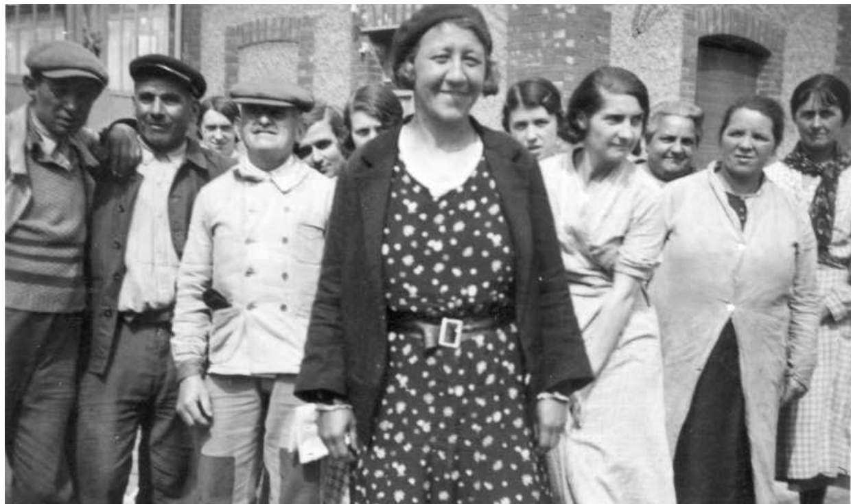
Sortie des ouvriers et ouvrières de la faïencerie, vers 1937-38