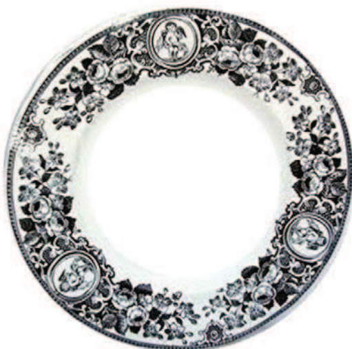
B 023 = 3 médaillons avec angelot, entourés de fleurs