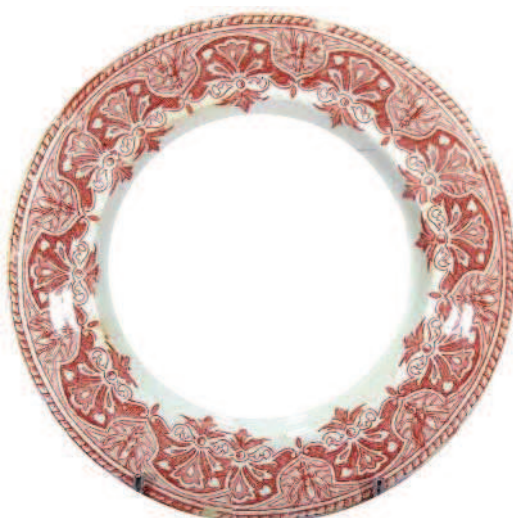
B 025 = abeilles et palmettes