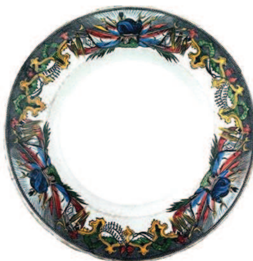
B 022 = motif ternaire avec turban et drapeaux