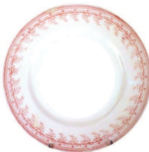
B 026 = fines brindilles fleuries