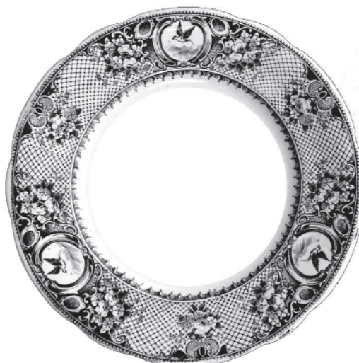
B 024 = 3 médaillons fleuris avec oiseau sur fond treillissé